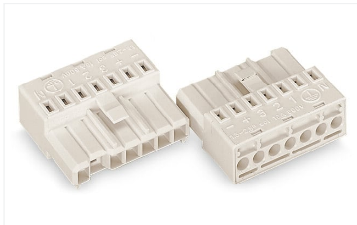
Kolor: ■ biały